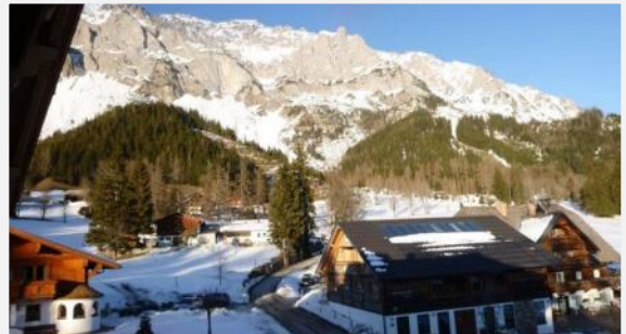
Der Rittisberg, unser Skigebiet